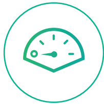
Burn-out & Psychische klachten